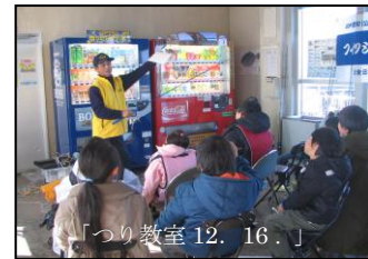
「つり教室 12. 16.」

さて最終日の 1 月 27 日(日) 10 時からの初心者つり教室参加者を対象に“おわかれ福引会”(限定 30 名・つり用品贈呈)を行います。当日 9 時から整理券を配布いたしますので、つり教室に、ふるってご参加ください。