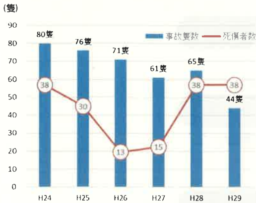
【遊漁船の事故隻数と死傷者数の推移】